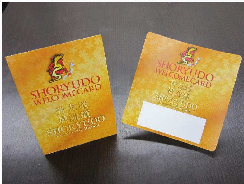
【POPツール 店舗用スタンド(左)とステッカー(右)】