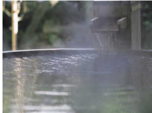
約1200年の歴史を持つ温泉