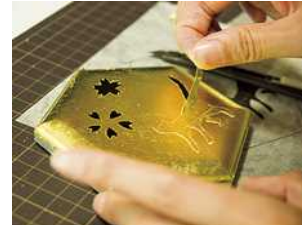
古都金沢の伝統工芸