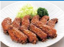
なごやめし(手羽先)