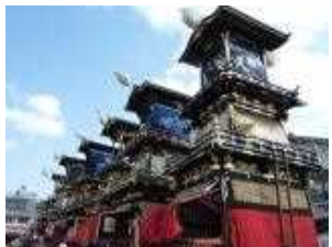
国指定重要無形民俗文化財