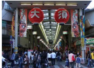
名古屋を代表する商店街