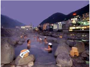
日本三名泉の一つ