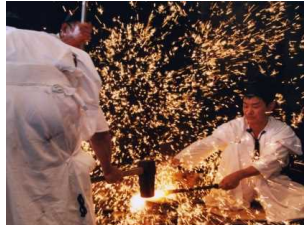
関鍛冶の技を今に伝える施設