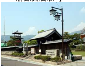
関ヶ原古戦場(岐阜県不破郡)