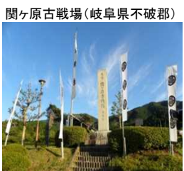
天下分け目の戦いの地