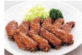
なごやめし(手羽先)