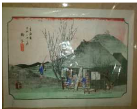
浮世絵師歌川広重の作品を中心にコレクションされた美術館