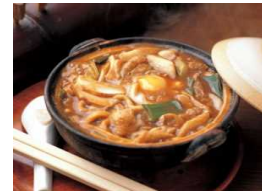
なごやめし(味噌煮込みうどん)