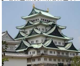
名古屋の象徴。金のシャチホコで有名