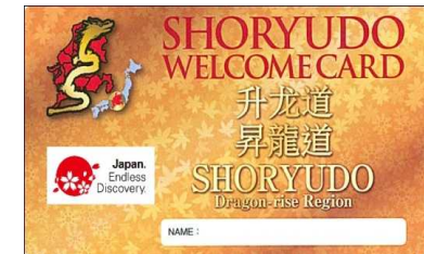
昇龍道ウェルカムカード