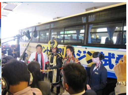
H25.5.13セントレアリムジン試乗会の模様