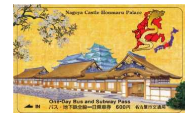
(名古屋交通局 バス・地下鉄1日乗車券)