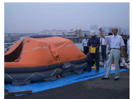
いかだ内装備品の点検