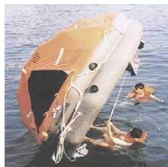
転覆したいかだを復正