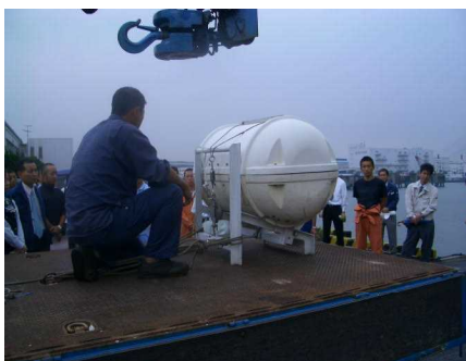
いかだの投下操作確認

膨張式救命いかだの投下操作確認→救命いかだを海中へ投下訓練（いかだ展張）→船員海面降下→反転・復正訓練→乗り込み→上陸後内装備品の点検・落下傘付き信号発射等訓練