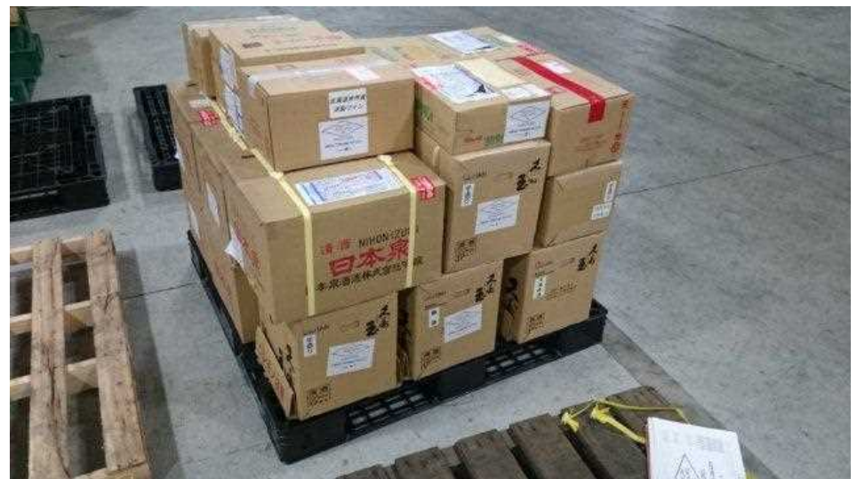
パレット積み付け時