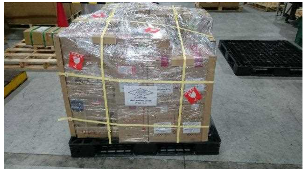
エアライン上屋搬入時