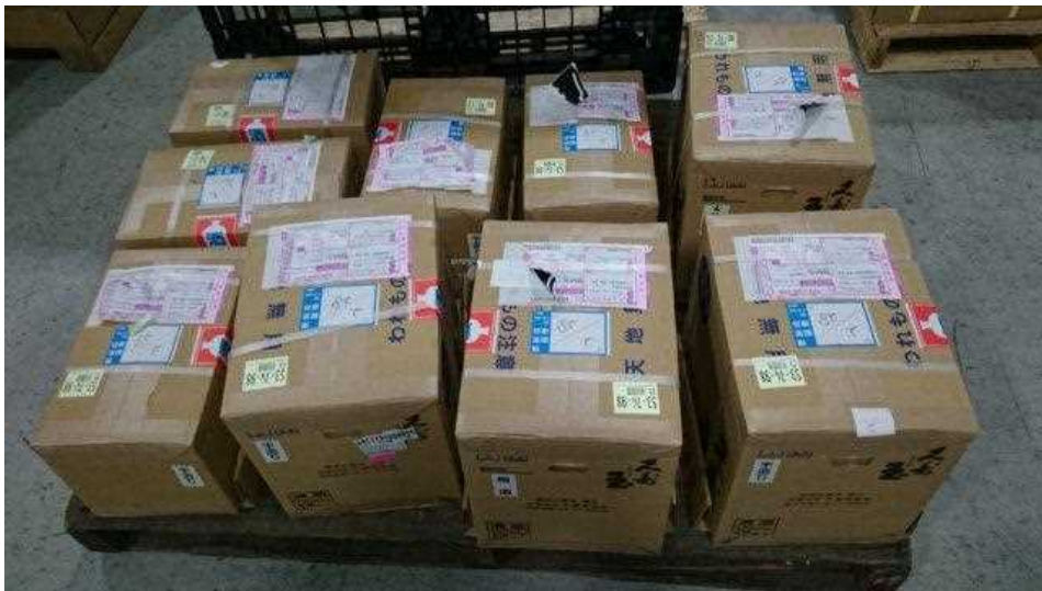
空港搬入時（バルク）