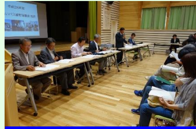
地域バス運営協議会にて検討