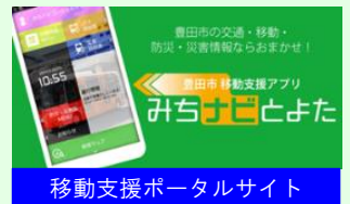
移動支援ポータルサイト