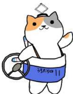
公共交通利用促進キャラクター のりたろう

当日取材を希望される方は、12月26日（水）までに裏面にご記入の上、ご連絡願います。