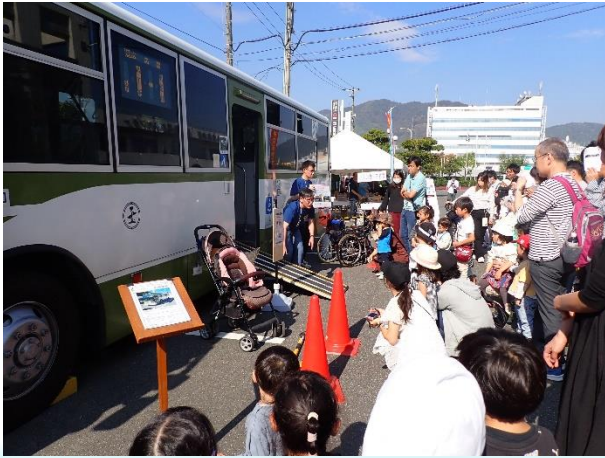
老若男女問わず、 多くの方にご参加いただきました！