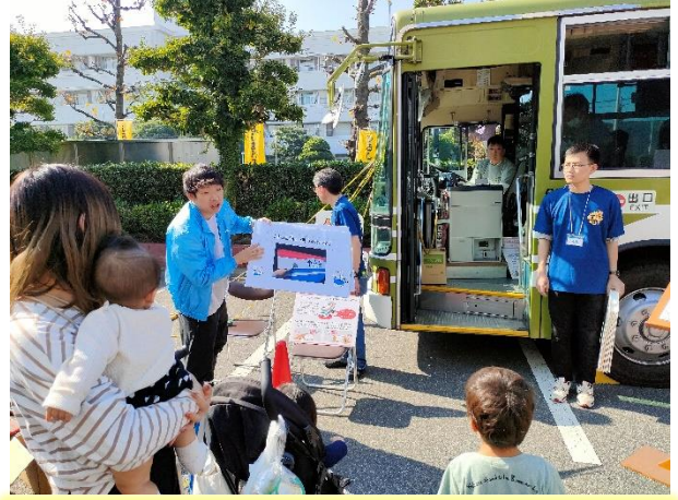
未就学児向けのバリアフリークイズで、 子ども達にも積極的に参加していただきました！