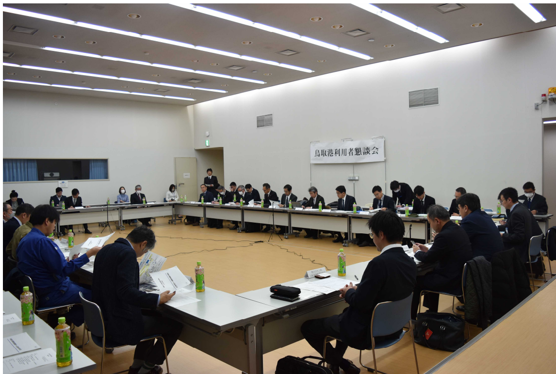
鳥取港利用者懇談会 開催状況