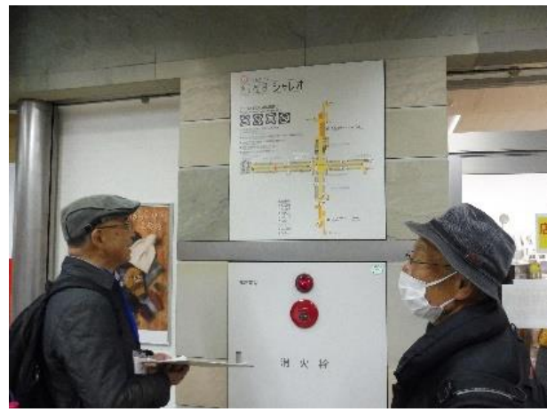
④シャレオ内の点検