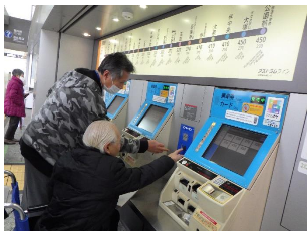
① 駅構内の点検（インターホン）