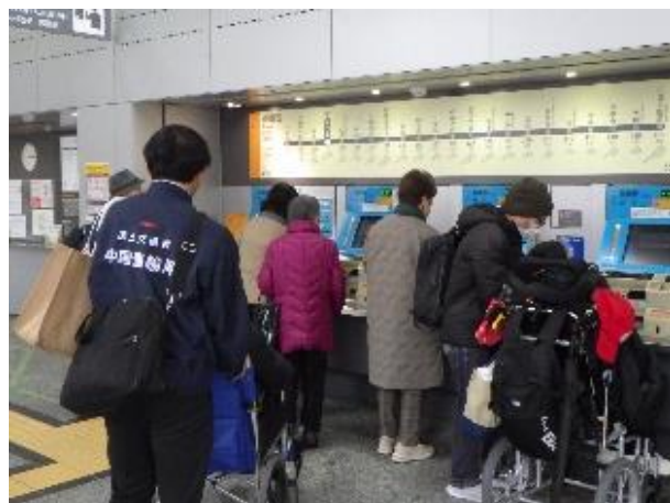
① 駅構内の点検（券売機）