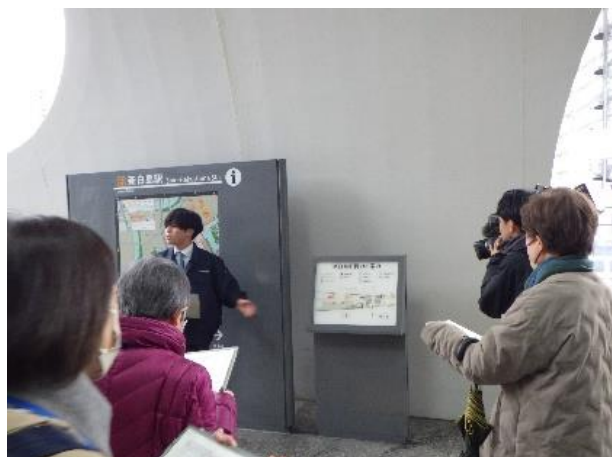
① 駅構内の点検（構内図）