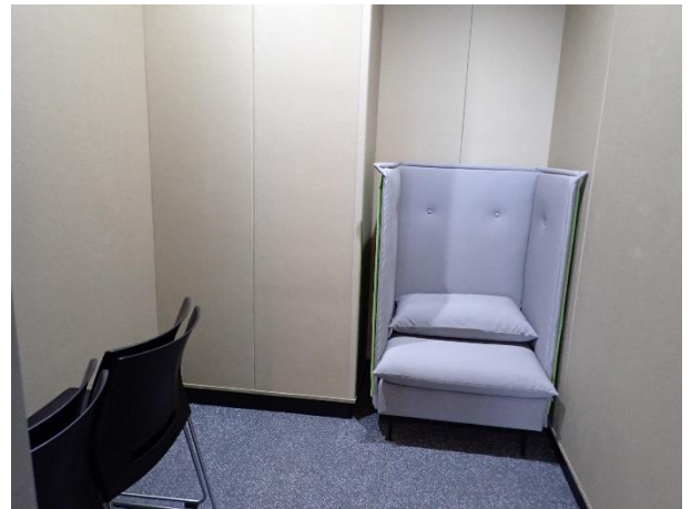
①カームダウンエリア