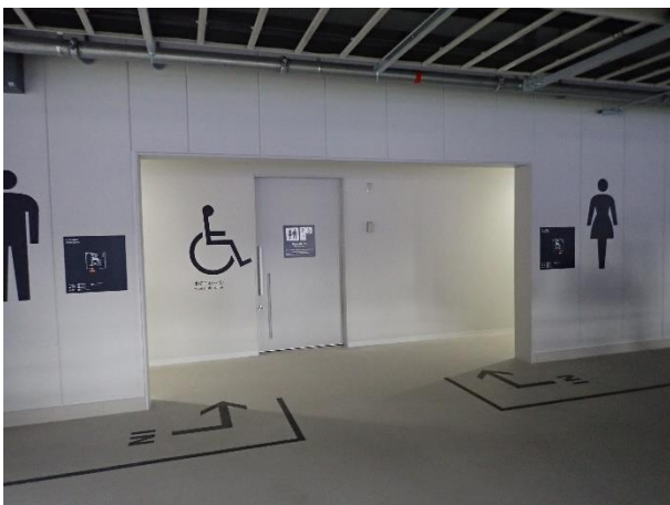
バリアフリースイートイレ兼男女共用トイレ (写真中央)