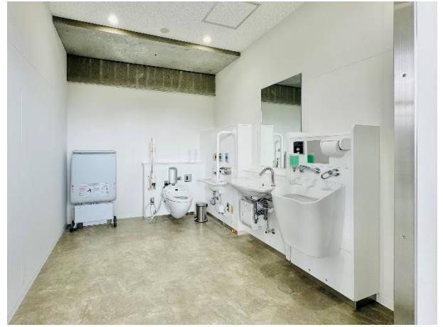
③バリアフリースイートイレ