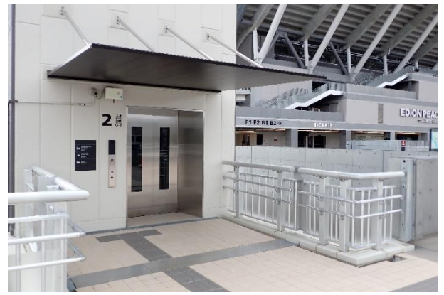
庇付きのエレベーター