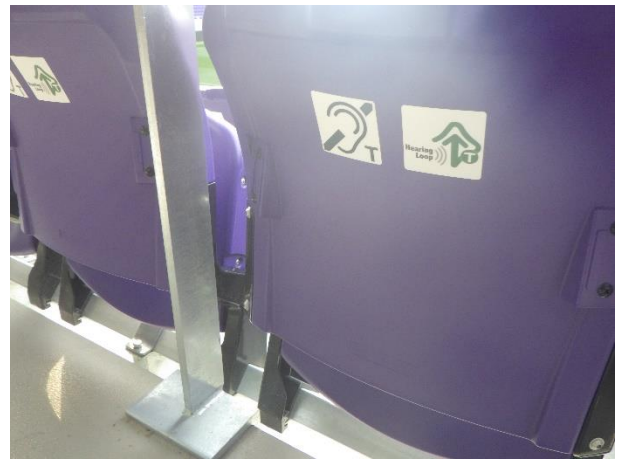
⑦ヒアリングループ設置席