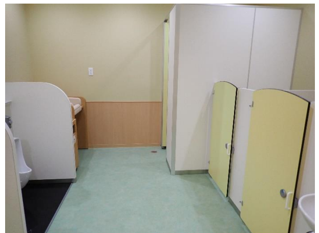
キッズルーム内子ども用トイレ (写真右側)