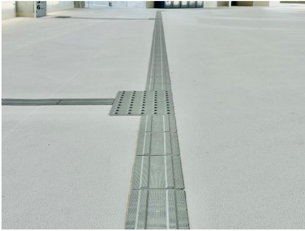
②広島モデルの視覚障害者誘導用ブロック