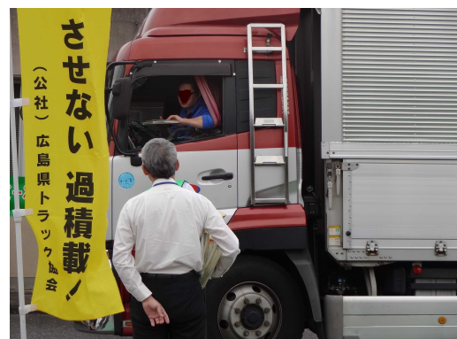
過去のキャンペーンの様子

広島県警察本部、広島労働局 中国地方整備局広島国道事務所 中国地方整備局福山河川国道事務所、 中国地方整備局三次河川国道事務所、 広島県、広島市、西日本高速道路(株)中国支社、 本州四国連絡高速道路(株)しまなみ尾道管理センター 広島高速道路公社、(公社)広島県トラック協会、 独立行政法人自動車技術総合機構、中国運輸局広島運輸支局 以上、13機関