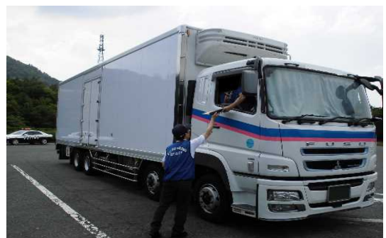
昨年度キャンペーン実施の様子

広島県警察本部、広島労働局 中国地方整備局広島国道事務所 中国地方整備局福山河川国道事務所、 中国地方整備局三次河川国道事務所、 広島県、広島市、西日本高速道路(株)中国支社、 本州四国連絡高速道路(株)しまなみ尾道管理センター 広島高速道路公社、(公社)広島県トラック協会、 (独)自動車技術総合機構中国検査部、中国運輸局広島運輸支局 以上、13機関