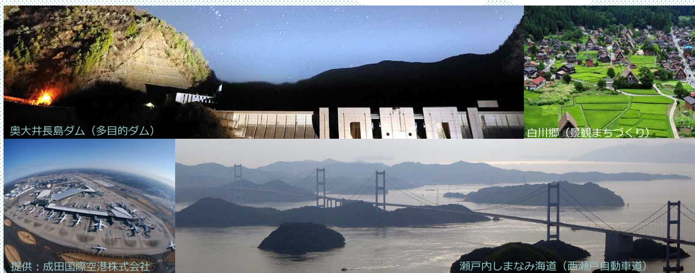
奥大井長島ダム (多目的ダム)