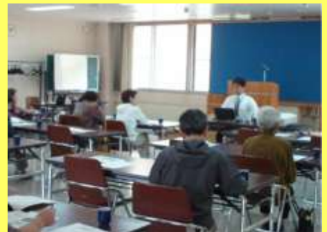
平成27年1月22日 小樽市 小樽商科大学 「船員の労働保護と船員法」