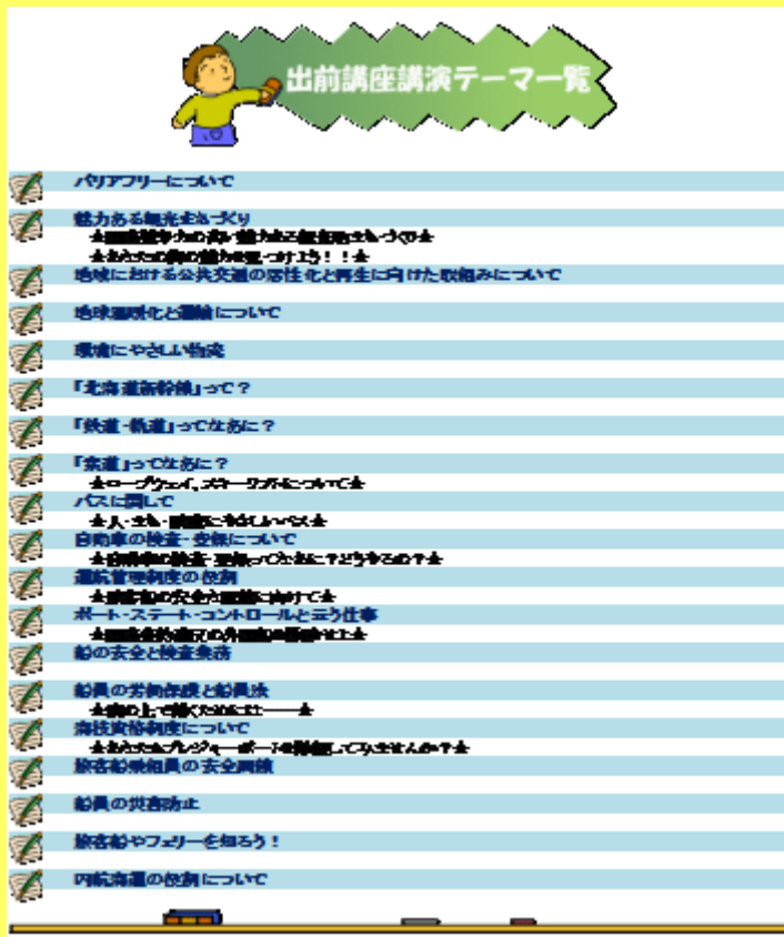
平成26年10月2日 歌志内市 歌志内市公民館 「北海道新幹線2016年開業」

平成26年度は、「北海道新幹線2016年開業」や「船員の労働保護と船員法」などについて計4回開催しています。