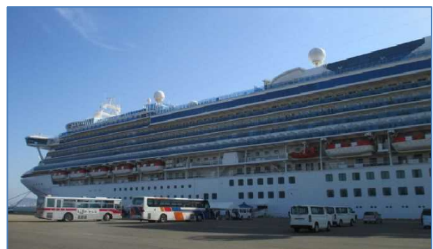
昨年5月に函館港へ寄港した「ダイヤモンド・プリンセス」

クァンタム・オブ・ザ・シーズ 運航会社:ロイヤル・カリビアン・インターナショナル(米国) 全長:348m 総トン数:167,800トン 全幅:41m 乗客定員:4,180名