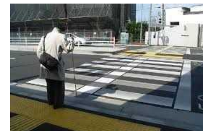
＜エスコートゾーンの例＞