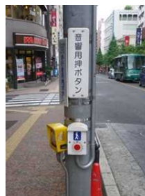
＜音響機能付加信号機の例＞