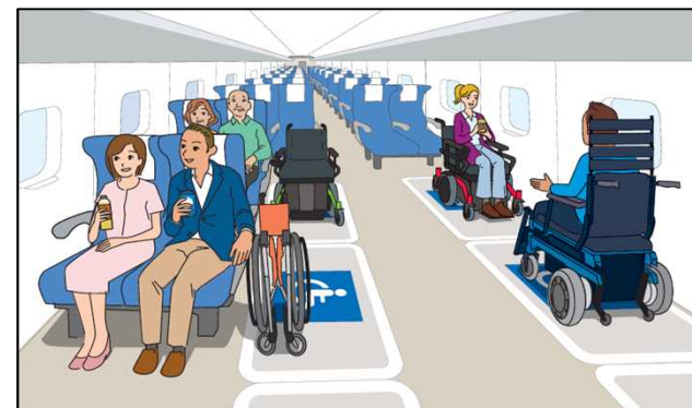
＜新幹線の車椅子フリースペースのイメージ例＞