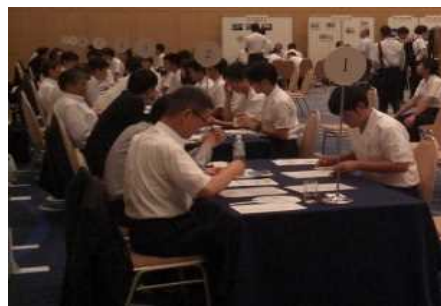
昨年度の会場風景