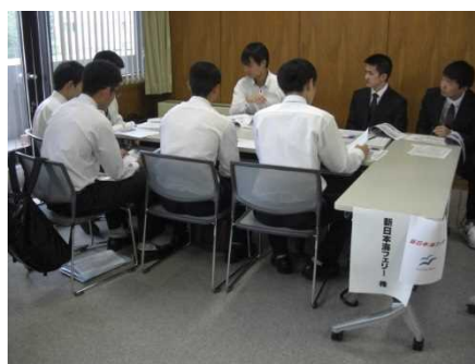
昨年度の会場風景