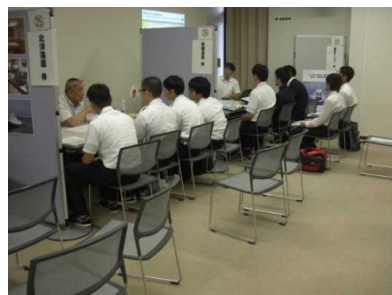
(平成30年開催時のセミナー会場の様子)