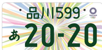
図柄入りナンバー (寄付金付き)

東京2020オリンピック・パラリンピックの開催を記念して交付されるものです。 本大会を支援する事業に寄付をされた方が選択できる「図柄入りナンバー」と誰でも交付が受けられる「エンブレム付きナンバー」の2種類があります。