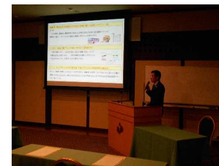
消費者行政・情報課長