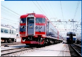
しなの鉄道 (上田市内4駅)