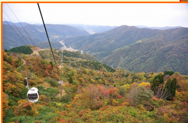
ゴンドラで山頂へ！広がる紅葉