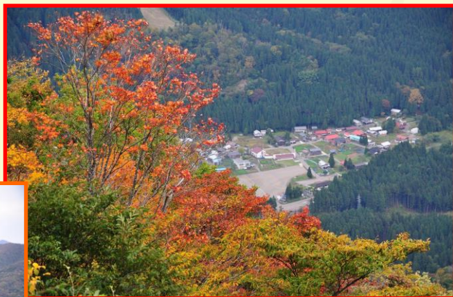
山あいの集落と紅葉

雪化粧した白山と連なる山々の紅葉との景色も美しく、季節の移り変わりを感じさせてくれます。