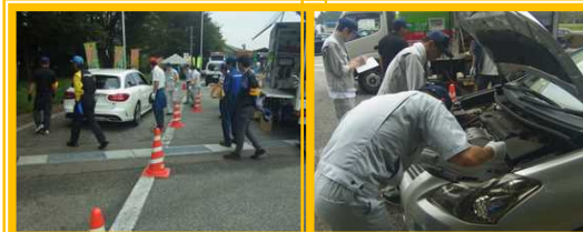
9月26日(月) 富山 北陸自動車道小矢部川SA (下り) 自動車無料点検 の実施