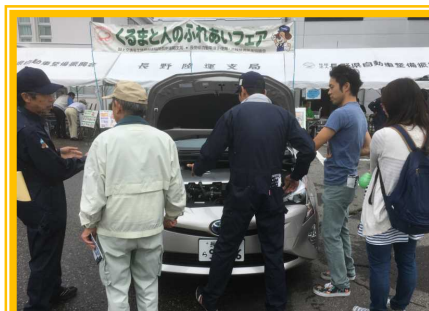
10月1日(土) 長野 自動車の日常点検方法の説明