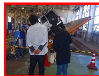
10月16日（日）富山 自動車検査場見学