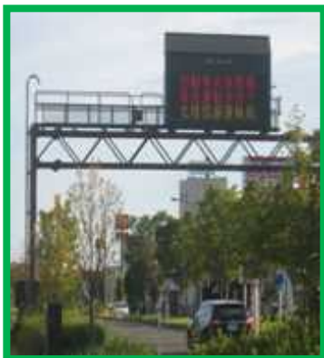
新潟県三条市 国道8号線 電光掲示板への掲示