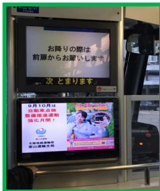
富山 電車内の掲示器による 掲示