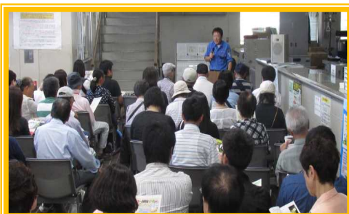
10月1日(土) 新潟 自動車なんでも相談の実施