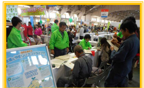
10月16日(日) 石川 自動車点検アンケートの実施