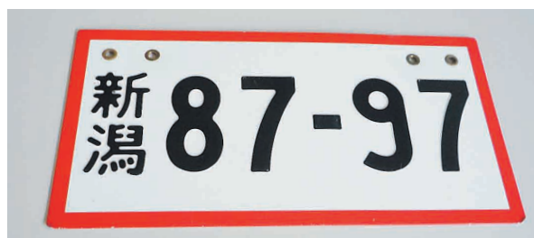
回送運行許可番号標

これらの運行要件を満たしていない自動車販売店や陸送事業者等における商品自動車については、反復継続して回送する必要があることから、回送運行許可制度が設けられており、当支局では、平成25年度末現在、547事業者について許可をしています。