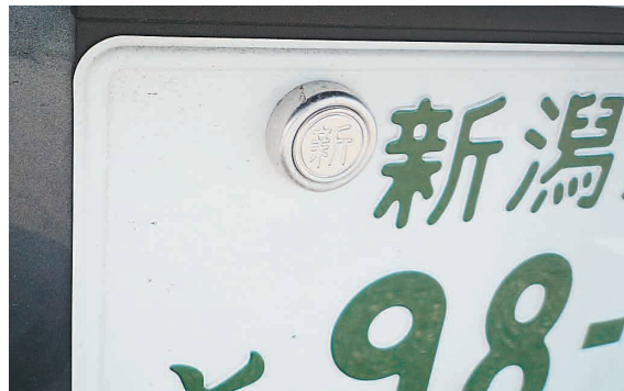
自動車番号標と封印

封印は登録ファイル及び自動車登録番号並びに自動車自体の同一性を確保する上で重要な役割を果たしており、適正な封印取付け業務が行われるよう、委託した者に対する定期的な監査を行っています。