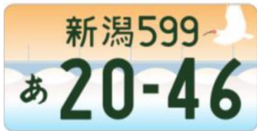
図柄入りナンバー「新潟」

また、令和3年12月末には「新たな全国版図柄入りナンバープレート」が発表されました。デザインは全国47都道府県の県花をモチーフに日本の美しさを表現しており、令和4年4月から令和9年4月末までの間が交付期間とされています。