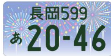
図柄入りナンバー「長岡」