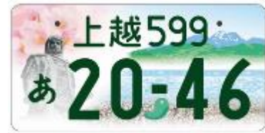
図柄入りナンバー「上越」