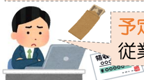
賃金の支払に困る事業主のAさん