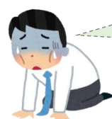
賃金の支払に困る事業主のAさん