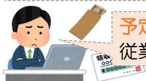
賃金の支払に困る事業主のAさん