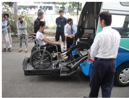
<タクシーの車いす体験・介助体験>