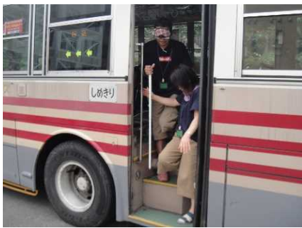
<視覚障害者疑似体験・介助体験>