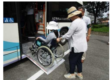
<バスの車いす体験・介助体験>