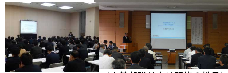
〈勉強会の様子〉 〈市幹部職員向け研修の様子〉