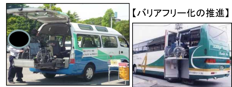
〈こころバリアフリー教室の様子〉 〈リフト付バス車両等の導入〉