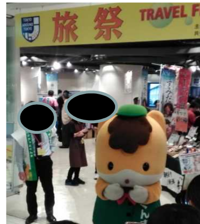
〔旅祭TRAVEL FESTIVAL2016 2016年11月@KITTE〕