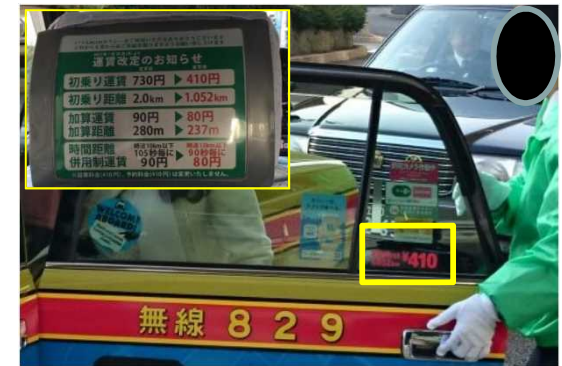
【タクシー初乗り短縮運賃の導入(H29.1.30～)】