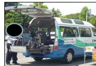
〈こころバリアフリー教室の様子〉