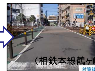
〈相鉄本線鶴ヶ峰10号踏切の改良〉