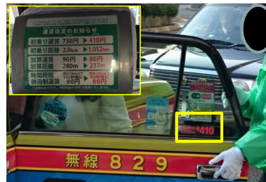
【タクシー初乗り短縮運賃の導入(H29.1.30～)】