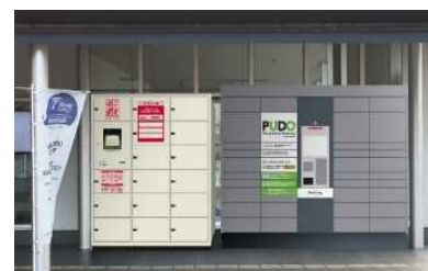
【公共空間における宅配ボックス】