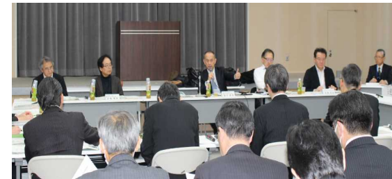
〈政策推進部会における議論の様子〉