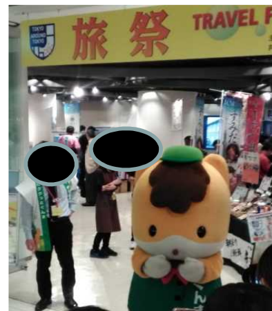
〔旅祭TRAVEL FESTIVAL2016 2016年11月@KITTE〕