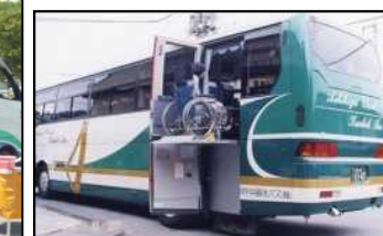
〈リフト付バス車両等の導入〉