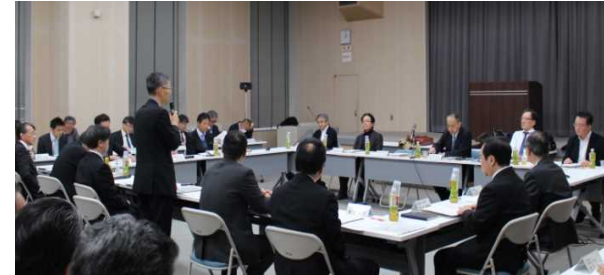
〈冒頭挨拶する持永関東運輸局長〉