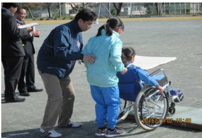
（昨年度開催の高崎市立南陽台小学校）

※詳細については別添資料のとおり。雨天時はタイムテーブルを一部変更して実施します。