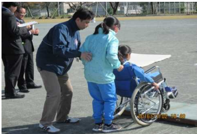
（昨年度開催の高崎市立南陽台小学校）

※詳細については別添資料のとおり。雨天時はタイムテーブルを一部変更して実施します。