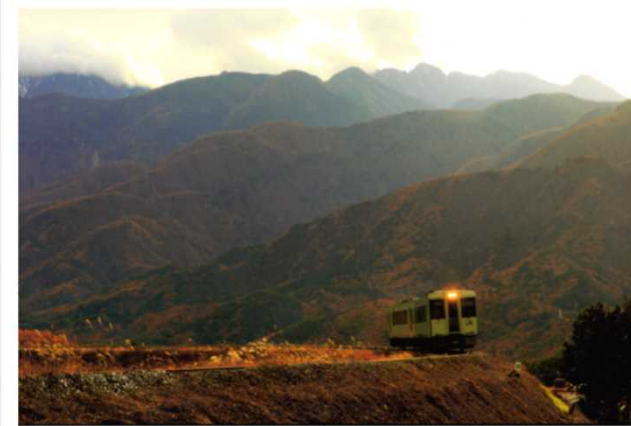
「晩秋の甲斐路」 松山 進 (JR東日本 小海線)