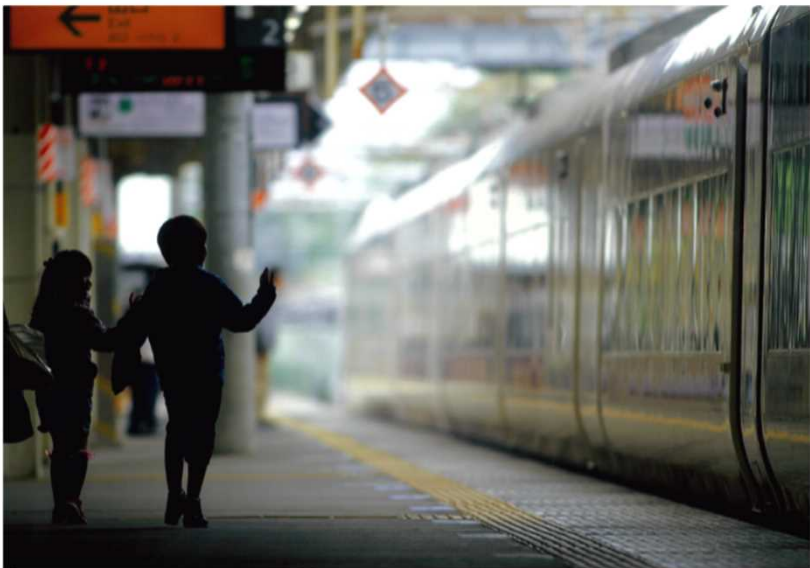
「バイバイ」 高丸 修一 (JR東日本 常磐線)