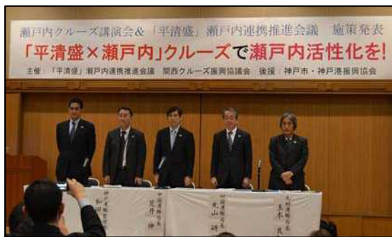
※会議を3局から5局に拡大。「瀬戸内クルーズ講演会」の開催、施策発表を行った。