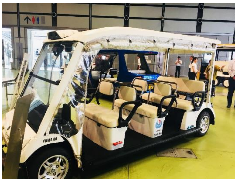
ヤマハの 7 人乗りゴルフカート

会場には、この日初お披露目となった eCOM8 2 のほか、7 人乗りゴルフカートなどのピカピカの車両 6 台が展示され、走行は出来なかったものの、実際に車両に触れていただき、座り心地やオープンさなどを確認いただきました。