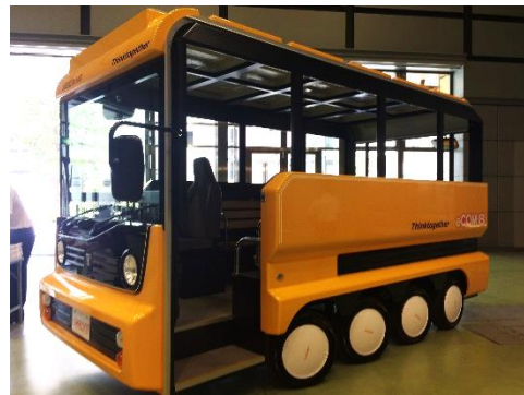
初お披露目の eCOM8 2

基調講演では、先行導入地域である、輪島商工会議所（石川県輪島市）、京都府、株式会社桐生再生（群馬県桐生市）より、各地域の導入した理由や苦労したお話などを交えながら活用事例をご紹介いただき、地域特性に合わせた導入が重要であることを再認識することができました。