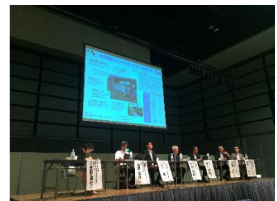
白熱するパネルディスカッション

応募方法等は こちら http://www.mlit.go.jp/report/press/sogo10_hh_000164.html