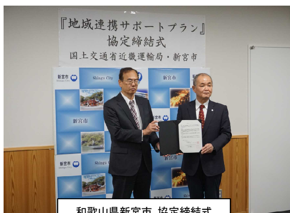
和歌山県新宮市 協定締結式

また、11月26日(木)に和歌山県新宮市と地域連携サポートプランの協定を締結しました。「クルマに依存せざるを得ない交通不便地域における移動手段の確保」、「路線バス、行政バスの利用低迷、維持・確保」等、新宮市で想定される公共交通の課題の解決につながる提案を行うため、関係者間で協議しながら、地域課題の解決に向けて近畿運輸局がサポートさせていただきます。