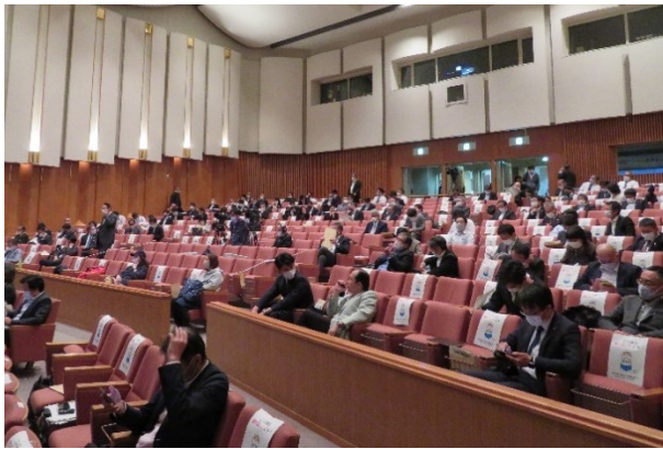
(間隔を1席ずつ確保し、使用不可の席にはのりたろうからの「お願い」を貼付けました。)

本セミナーの開催が原因でクラスターが発生することが無いよう、開催方法については細心の注意を払い、運輸局としては初となる「YouTube ライブ配信」も同時に行うこととしました。会場においても「密」を避けるためエレベーターに乗れる人数の制限、「大阪コロナ追跡システム」への登録のお願いや検温等、可能な限りの対策を取りました。