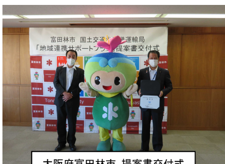
大阪府富田林市 提案書交付式