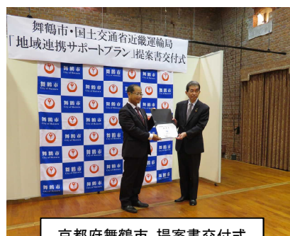
京都府舞鶴市 提案書交付式

また、11月26日(木)に和歌山県新宮市と地域連携サポートプランの協定を締結しました。「クルマに依存せざるを得ない交通不便地域における移動手段の確保」、「路線バス、行政バスの利用低迷、維持・確保」等、新宮市で想定される公共交通の課題の解決につながる提案を行うため、関係者間で協議しながら、地域課題の解決に向けて近畿運輸局がサポートさせていただきます。