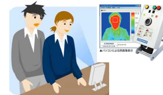
熱感知カメラ設置による感染者の公共交通利用自粛励行