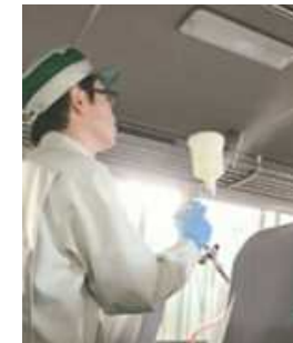
車内の抗菌・抗ウイルス対策