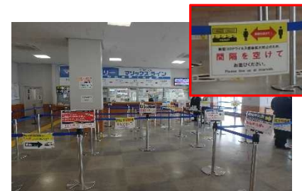
ターミナル等の衛生対策