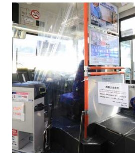
バス運転席仕切りカーテン