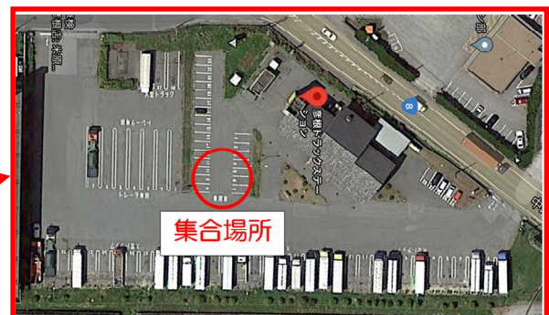
彦根トラックステーション（彦根TS）