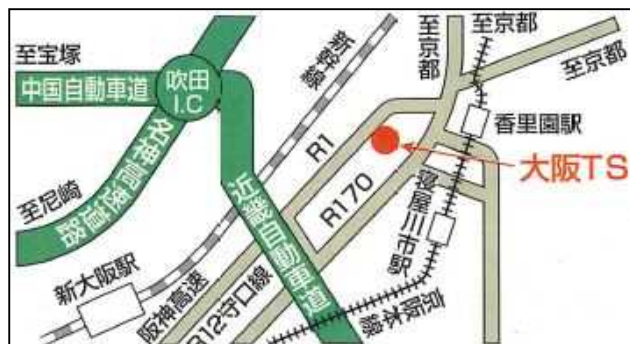
大阪トラックステーション（大阪TS）