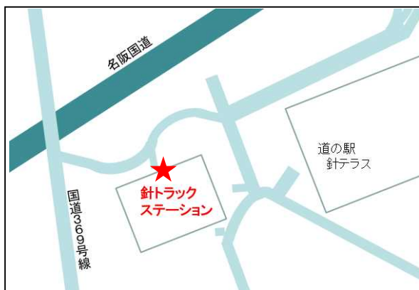
針トラックステーション（針TS）