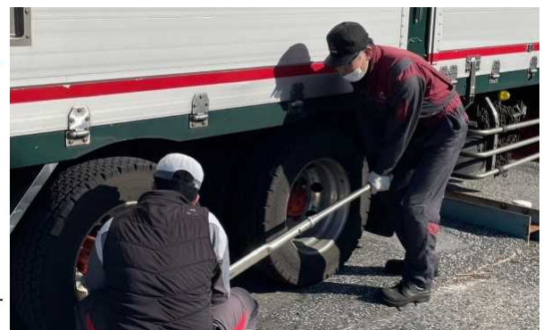
彦根トラックステーションでの点検の様子