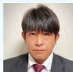
株式会社クボタ 物流統括部担当部長