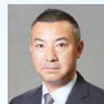
国土交通省港湾局 港湾経済課長