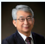
京都大学 名誉教授