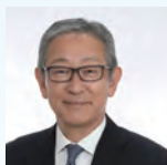
阪神国際港湾株式会社 代表取締役社長