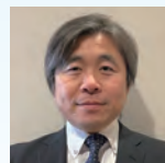
株式会社ノーリツ 生産管理部物流グループリーダー