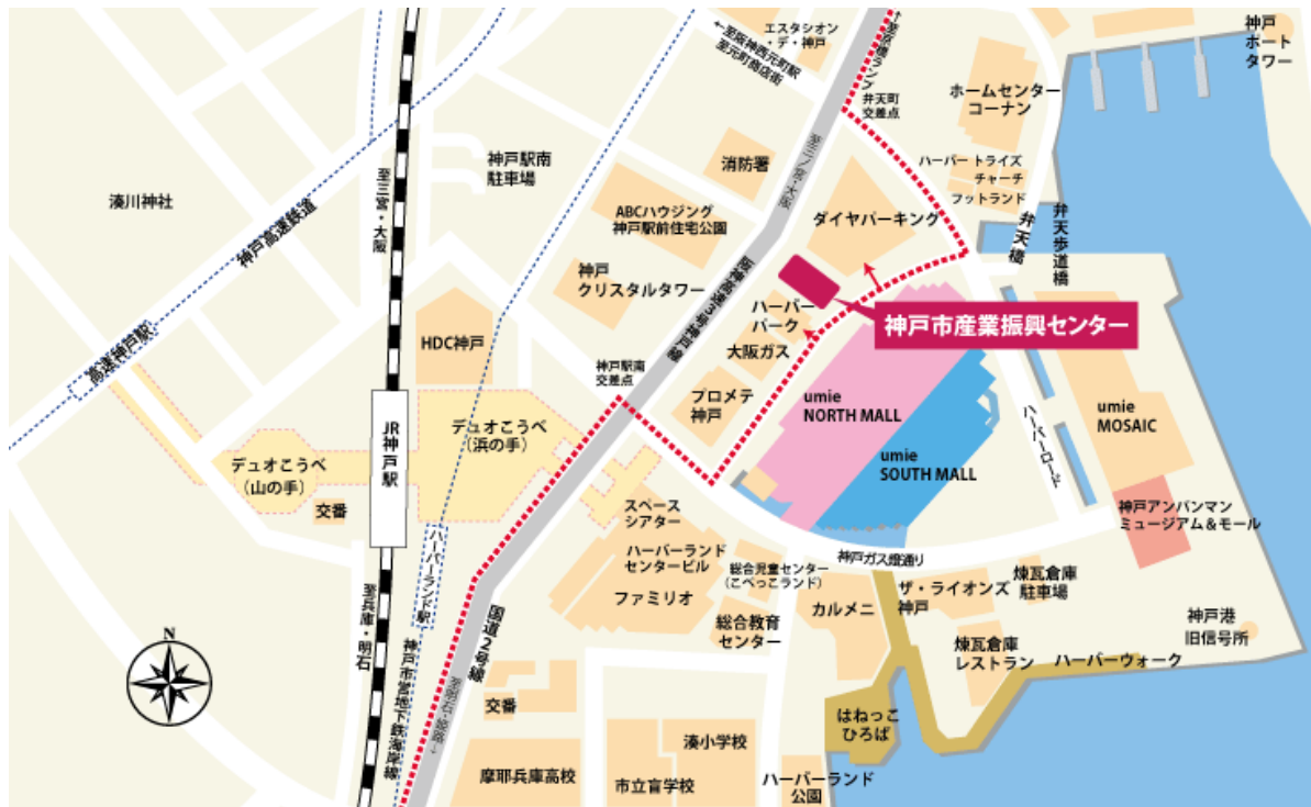
神戸駅前地下街(デュオこうべ)拡大図