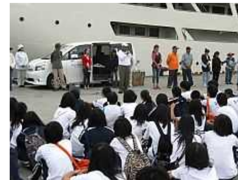
民家体験泊を行う修学旅行生への説明風景

(参考URL) http://www.iekanko.jp/guesthouses