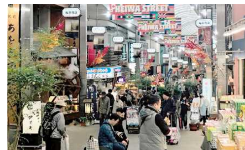
大勢の観光客で賑わう熱海市の商店街