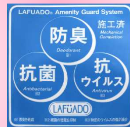
抗菌済みステッカーを掲出