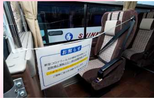
予約制高速バスでの空席確保