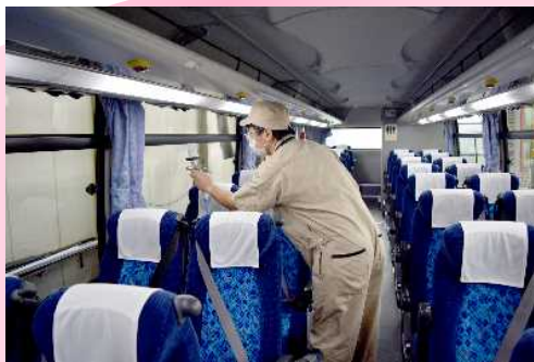
座席に抗菌剤を吹き付け