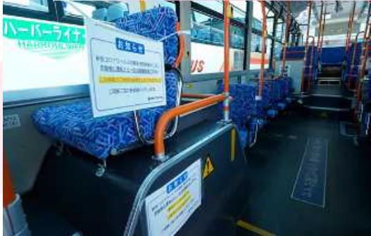
最前列の使用制限