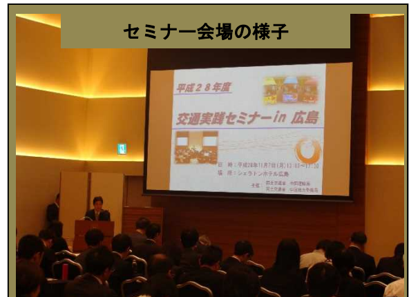
セミナー会場の様子

公共交通を通じ地域をよりよくしたいという思いを具現化するための公共交通の利用促進に向けた様々な地域の取組みや、デマンド交通の先進事例、ICカードやシステムによる運行状況の見える化などの先進技術の紹介は、公共交通に携わる参加者のみなさまのみならず、セミナーを主催した私たち職員にとっても非常に刺激となる貴重な経験となりました。