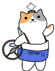
公共交通利用促進 キャラクター のりたろう

★ 全国に共有したい情報等ございましたら、下記問い合わせ先または最寄りの地方運輸局までお問い合わせください。