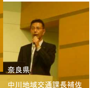
奈良県 中川地域交通課長補佐

の策定に至った状況をお話いただきました。また10月下旬に発生した地震から間もない中、講師としてお越しいただきました鳥取県からは、地震復旧支援への謝辞とともに、県内を生活圈ごとに分けし、米子市周辺を皮切りとして県全域で計画を策定する構想や、計画策定に当たっての留意点などについてお話いただきました。共に地域にふさわしい交通計画とはどうあるべきなのか、改めて参加者に問うものとなりました。