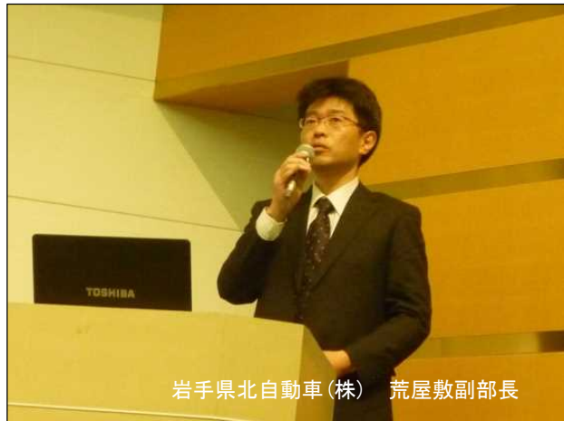
岩手県北自動車(株) 荒屋敷副部長