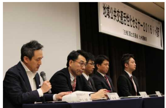
講師への質疑応答(27日)

27日のセミナーは168名の参加を頂き、タクシーも公共交通の重要な役割を担っているとの視点からタクシーを中心とした先進的な取り組みを紹介しました。九州管内の市町村においても急速な人口減少、高齢化が進行しており、これまでより小規模な輸送需要が多くなることが想定されています。その中で、持続可能な公共交通体系の構築に向けて、タクシーを地域公共交通の一部として位置づけ、幅広い取り組みを進めていく必要があります。今回のセミナーにおいて紹介した事業者や自治体の先進的な取り組みが、タクシーの役割を改めて考える契機となることを期待しています。