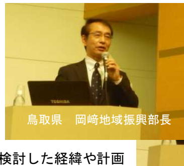
鳥取県 岡崎地域振興部長

として、県が音頭を取り地域公共交通網形成計画を策定した奈良県及び鳥取県の担当者から「広域的な地域公共交通網形成計画の策定について」と題して講演いただきました。奈良県からはかつて県内バス事業者の経営状況の悪化に端を発し地域ごとに路線バスの課題を丁寧に議論し、県域全体でバス路線の必要性等を検討した経緯や計画