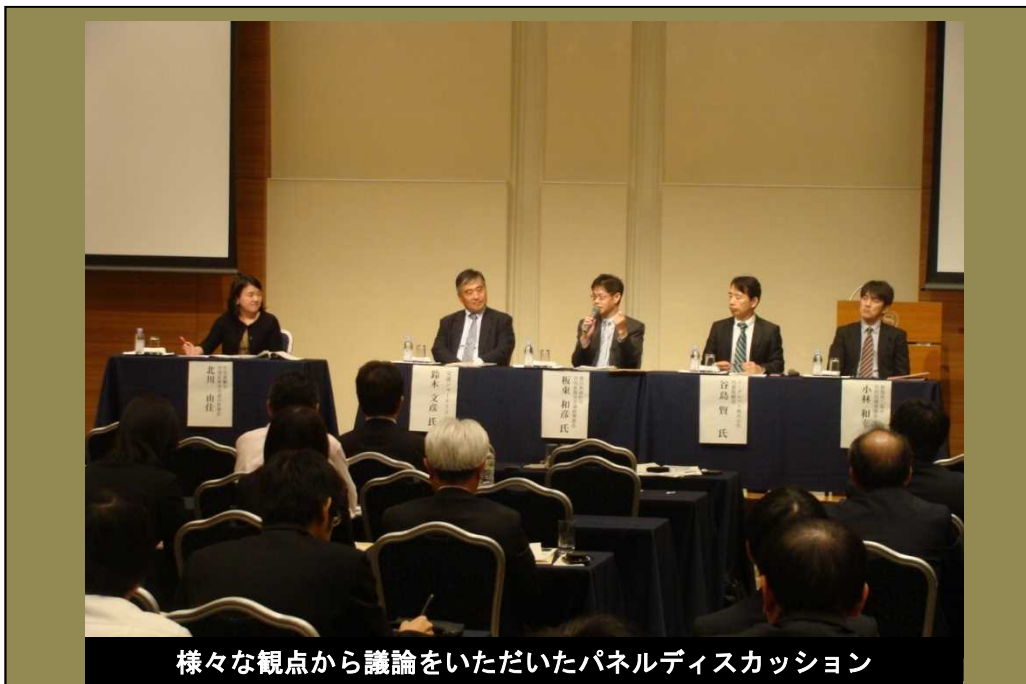
様々な観点から議論をいただいたパネルディスカッション

中国運輸局では、今後もこのようなセミナー開催等を通じ、中国地方の地域公共交通が持続的に確保維持されるよう、地域の皆さまとともに課題解決に向けて取り組んでまいります。