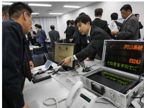
システム提供者との個別相談会の様子