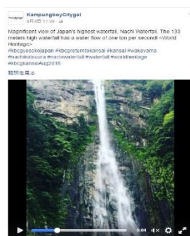
パワーブロガーによる情報発信（インターネットWEB）