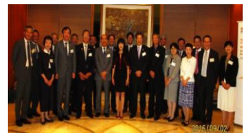
【香港貿易発展局 方 舜文 総裁 他】