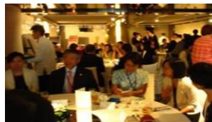
【台湾交流レセプション】