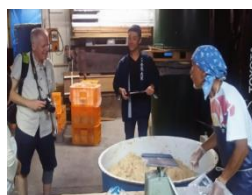
酒蔵取材（メディアファム）