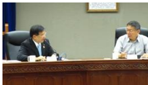
【台北市政府 柯 文哲 市長】