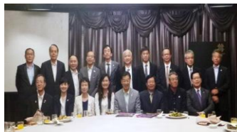
【高雄市政府 楊 明州 秘書長 他】