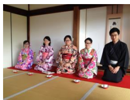
着物体験（エージェントファム）