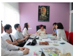
海外旅行会社訪問（セールスコール）