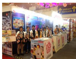
旅行博共同出展（旅行博、イベント）