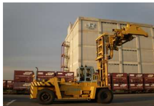
トップリフターによる作業