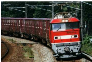
貨物列車

最寄の駅は、京阪電車・地下鉄谷町線「天満橋駅」です。 地下鉄をご利用の場合、3番出口から東方向(大阪城側)へ徒歩約2分です。